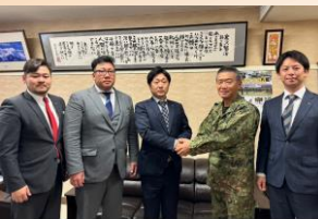
第二普通科連隊長