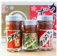
かんゆずり入り3点セット