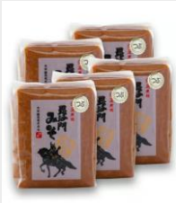
黒沙門みそ (つば) 1kg×5個