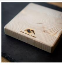
SDGs廃材活用コースター