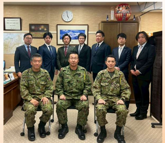
高田駐屯地司令、第二普通科連隊長